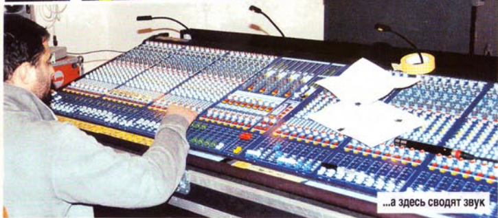
...а здесь сводят звук