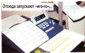
Отсюда запускают «иго-го»...