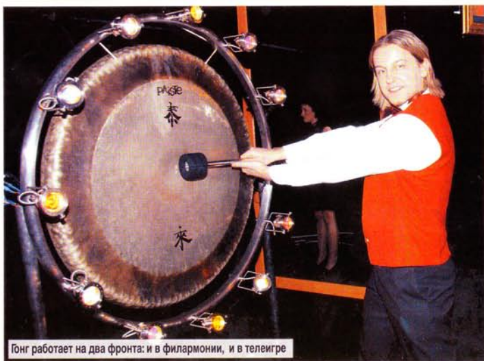
Гонг работает на два фронта: и в филармонии, и в телеигре