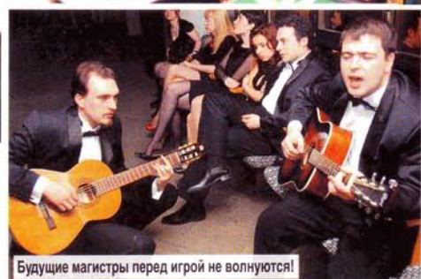
Будущие магистры перед игрой не волнуются!

ЭТА ПЕРЕДАЧА ОДНА ИЗ НЕМНОГИХ, ВЫЖИВШИХ В ВУРНОЙ СМЕНЕ ТЕЛЕФОРМАТОВ И ТЕЛЕМОД. УЖЕ ДЕТИ ПЕРВЫХ ЗНАТКОВ САДЯТСЯ ЗА СТОЛ В ИНТЕЛЛЕКТУАЛЬНОМ КАЗИНО, ГДЕ ДЕНЬГИ МОЖНО ЗАРАБОТАТЬ СОБСТВЕННЫМ УМОМ.